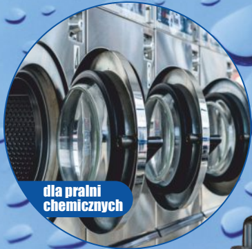
dla pralni chemicznych