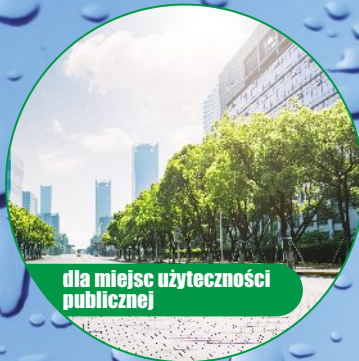
dla miejsc użyteczności publicznej